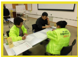
ニーズ聞き取り訓練