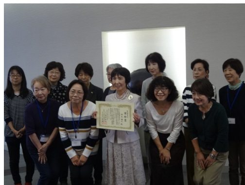
音声訳の会の皆様