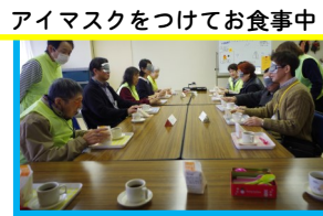
アイマスクをつけてお食事中！