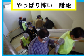
やっぱり怖い 階段