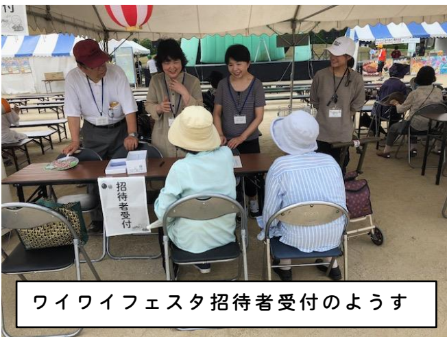
ワイワイフェスタ招待者受付のようす

平成30年8月5日(日)ワイワイフェスタに地域の単身高齢者を招待しました。「初めて参加した」という人がたくさんおり、住民の地区行事への参加を促進できました。合わせて「参加できなかった人の理由」をアンケートで把握し、高齢者にとっての地域の課題も検討しました。これからも丁寧に住民の方の声を聞きながら、活動を進めていきます。