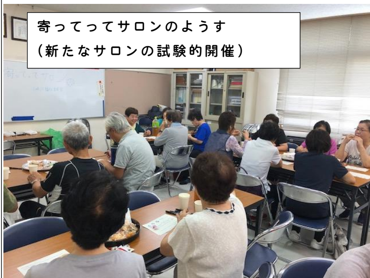
寄ってってサロンのようす (新たなサロンの試験的開催)

小垣江地区内の各地で、高齢者が気軽に集まれる機会としてラジオ体操を広めています。いきいきクラブやボランティア団体の協力で、現在地区内7か所でラジオ体操開催中です。また、今年度からは新たなサロン活動の検討もはじめました。これからも地域の方の健康づくり、居場所づくり等を進めていきます。