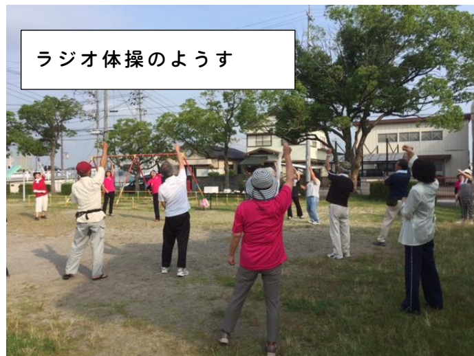
ラジオ体操のようす