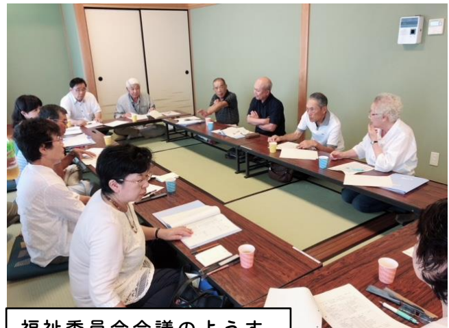
福祉委員会会議のようす