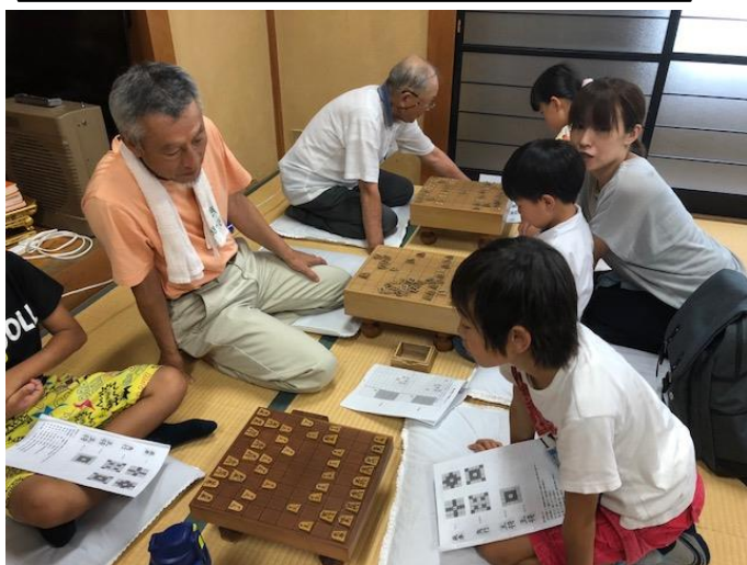
多世代サロンの将棋コーナーのようす